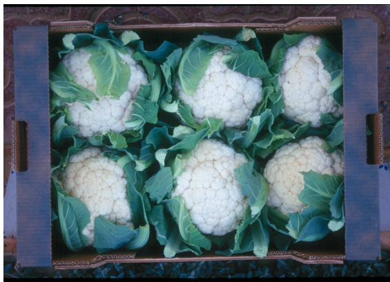
Encaixat de 6 peces

El mercat nacional preferix florícols grans: al voltant d'1,5 kg per peça, que correspon a una confecció de 5 a 6 peces per caixa, encara que a vegades admet també calibres lleugerament inferiors, de 8 peces per caixa. Hi ha mercats d'exportació que preferixen florícols de 600 a 1.000 g per peça.