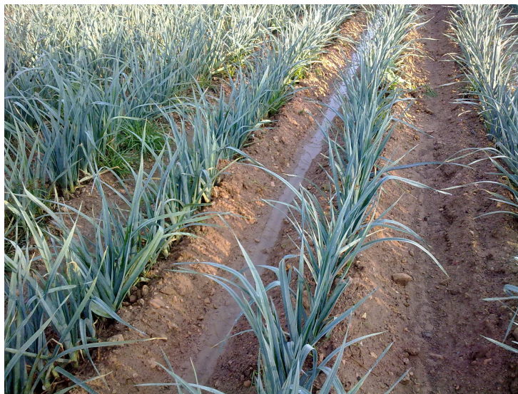
Sistema de cultivo del puerro de industria

En cuanto a la problemática fitosanitaria, durante el cultivo, se controlaron las poblaciones de trips y triozas no produciendo daños directos, en un principio, aunque se piensa que pueden ser vectores de diferentes enfermedades del puerro. Únicamente al final del ciclo, coincidiendo con el final del verano, se empezaron a detectar hongos de cuello y un “colapso general” de toda la parcela. En otras parcelas de la zona, también se han detectado estos problemas, estando dicha problemática en estudio, no pudiendo concluir nada, al ser la sintomatología muy diversa.