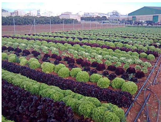
Foto 1. Ensayo variedades de lechuga 4ª gama