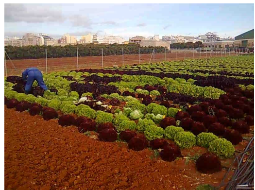
Foto 2. Recolección ensayo variedades de lechuga 4ª gama