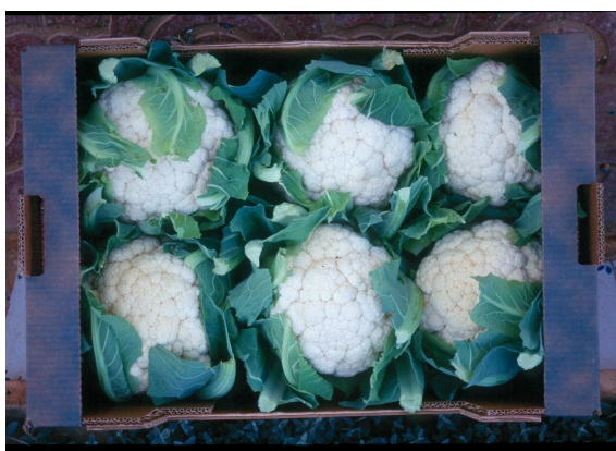
Encajado de 6 piezas

El mercado nacional prefiere coliflores de gran tamaño: alrededor del 1,5 kg por pieza, que corresponde a una confección de 5 a 6 piezas por caja, aunque en ocasiones admite también calibres ligeramente inferiores, de 8 piezas por caja. Existen mercados de exportación que prefieren coliflores de 600 a 1.000 g por pieza.