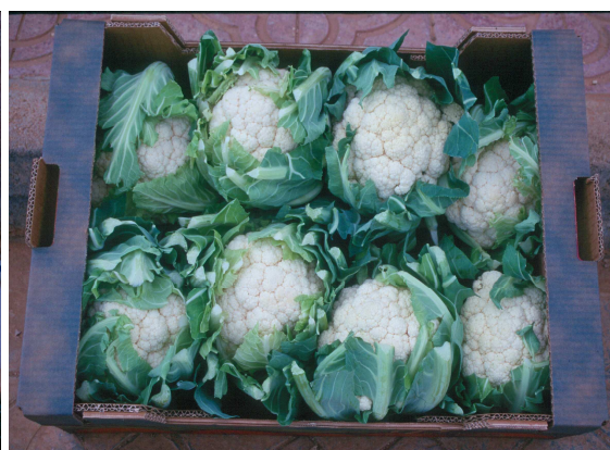
Encajado de 8 piezas

A pesar de que el mercado nacional demanda coliflores de calibre alto, en las tablas que adjuntamos a continuación se muestran los diferentes marcos de plantación que se suelen utilizar dependiendo del calibre final de pella que se desea obtener. De esta forma, variando la distancia entre líneas (m) y la distancia entre plantas (m) se producirá pellas de calibre comercial alta, medio y bajo deseado, según la densidad de plantación seleccionada.